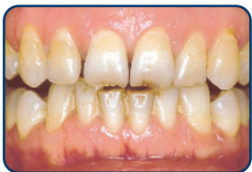
Voor het bleken

Een optimaal resultaat is niet altijd haalbaar. Het resultaat dat u bereikt met behulp van het bleken is meestal niet blijvend. Een paar jaar na het bleken,