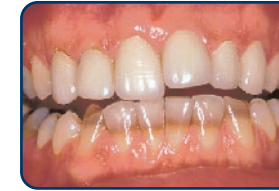
Ontwikkelingsstoornissen in de tandkiem