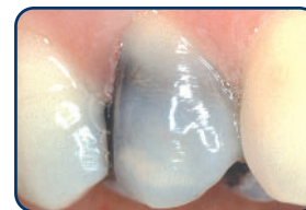
Grijze of zwarte vulling