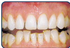
Na het bleken (en repareren)

komt de verkleuring vaak weer terug, omdat het tandbeen verandert en het glazuur weer kleurstoffen opneemt. Hierdoor verkleuren ze uw gebleekte tanden opnieuw. Dit proces gaat sneller als u rookt of bepaalde voedingsstoffen veel gebruikt. Het effect van langdurig of herhaald bleken op het tandweefsel is nog niet helemaal bekend. Bleek uw tanden daarom onder toezicht en controle van uw tandarts of mondhygiënist.