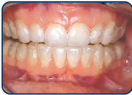
De bleeklepel is doorzichtig en valt daardoor bijna niet op

Thuis bleken is met name geschikt voor te gele of verkleurde tanden, bijvoorbeeld als gevolg van het verouderingsproces. Deze manier van bleken kan alleen bij egale, niet te ernstige verkleuringen. Uw tandarts maakt een goed passende 'bleeklepel' van een zachte kunststof. In de bleeklepel brengt u een gel aan met een blekende werking. Draag deze lepel tenminste twee weken enkele uren per dag. Afhankelijk van de verkleuring ziet u na enkele dagen of weken resultaat. Tijdens het gebruik van de bleeklepel kunnen uw tanden en tandvles tijdelijk gevoelig worden. Raadpleeg uw tandarts als deze klacht optreedt.